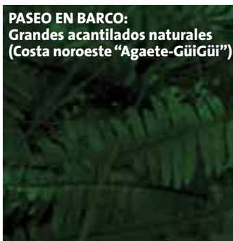
PASEO EN BARCO: Grandes acantilados naturales (Costa noroeste "Agaete-GüiGüi")