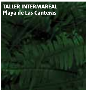
TALLER INTERMAREAL Playa de Las Canteras